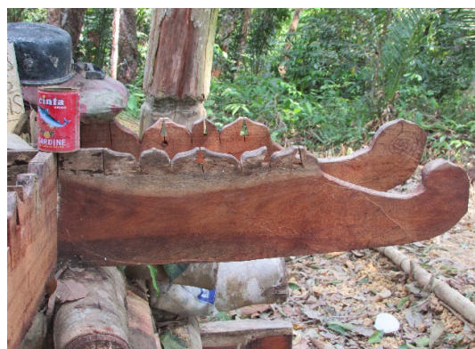
Rajah 3. Contoh Galang Kubur yang Diukir