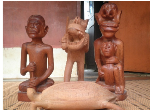
Rajah 4. Contoh Ukiran yang Dihasilkan Untuk Hiasan

Ukiran yang dihasilkan oleh kaum Jah Hut ini merupakan satu keunikan yang luar biasa bagi masyarakat luar yang melihat dan menyukainya. Setiap ukiran hanya diukir menggunakan perkakas tangan tanpa mesin. Hasil yang diperoleh sangat luar biasa. Nilai estetikanya yang tersendiri membuatkan ukiran patung yang dihasilkan pernah menjadi kebanggaan dalam masyarakat mereka suatu ketika dahulu dan diketengahkan sehingga dikenali oleh pelancong asing.