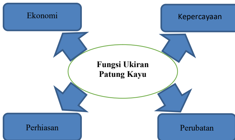
Rajah 2. Fungsi Ukiran Patung Kayu Suku Kaum Jah Hut

Pengkaji dapat melihat sendiri pembuatan pengukiran patung kayu ini melalui kaedah temu bual tidak berstruktur, pemerhatian dan rakaman visual di perkampungan Ulu Cheka Jerantut. Aktiviti harian yang dijalankan oleh mereka sememangnya mempengaruhi kepercayaan, adat resam dan juga kesenian yang mereka warisi. Karya-karya yang dihasilkan mereka sepenuhnya bersandarkan kepada alam persekitaran yang dilihat sendiri. Setiap hasil ukiran patung ini membawa maksud tertentu mengikut kegunaannya pada ketika dahulu. Ukiran patung kayu yang dihasilkan sememangnya unik dan tidak terjangkau di fikiran kita. Setiap penghasilannya membawa maksud yang tersendiri dengan kegunaannya yang tertentu dalam kehidupan masyarakat suku kaum Jah Hut.