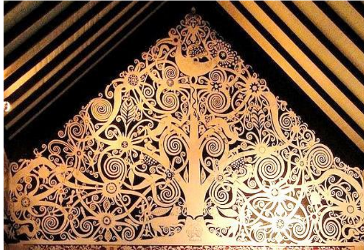
Gambar 2. Kalong Kayu Aren

Dalam aspek seni bina masyarakat Orang Ulu, motif ini lazimnya diukir pada dinding hadapan bilik ketua rumah panjang. Motif ini mendapat gelaran ‘pokok kehidupan’ berdasarkan kepada bentuk lukisan Kalong itu sendiri yang dihiasi dengan pelbagai jenis binatang, tumbuh-tumbuhan dan buah-buahan iaitu yang melambangkan sifat saling bergantung dalam kalangan penduduk dalam usaha untuk mewujudkan kumpulan masyarakat yang seimbang, harmoni dan kuat. Pendek kata, ia berkisar mengenai kehidupan di sesebuah rumah panjang dalam masyarakat Orang Ulu.