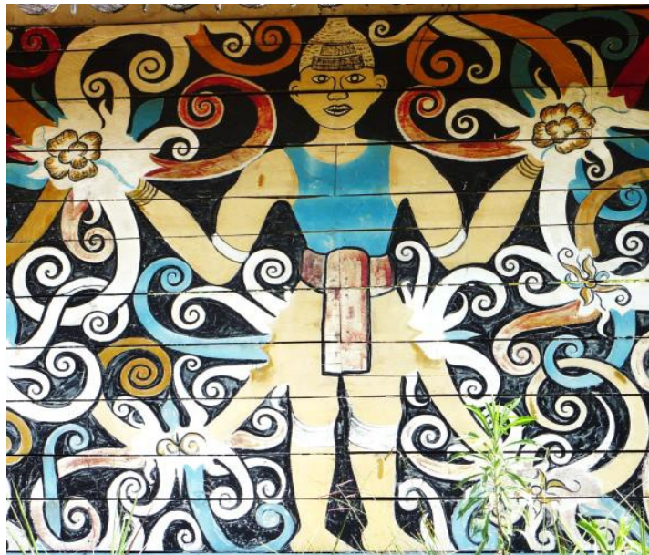
Gambar 4. Kalong Kelunan

Kalong Kelunan / Manusia (Gambar 4) dalam masyarakat Orang Ulu menggambarkan motif bentuk manusia yang masih bergaya di zaman prasejarah dimana manusia tidak digambarkan dalam bentuk yang realistik namun figuratif. Kalong Kelunan dalam masyarakat Orang Ulu merupakan motif yang tidak mendapat sebarang pengaruh kesenian klasik seperti pengaruh kesenian Hindu dan Budha sebagaimana yang berkembang pesat di Jawa dan Bali. Motif Kalong Kelunan banyak digunakan sebagai hiasan pada dinding rumah ketua rumah panjang, alat penggendong bayi, pakaian dan kain sarung wanita serta beberapa peralatan yang lain. Motif ini melambangkan kekuasaan, kekayaan dan kepimpinan yang disegani [10].