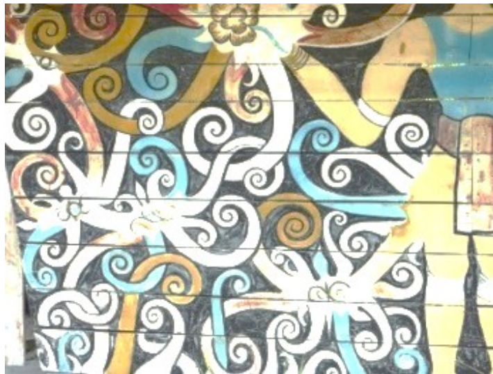
Gambar 1. Kalong Kelawit-Kawit

Kalong Kelawit-Kawit (motif salur paut) (Gambar 1) yang diilhamkan daripada tumbuh-tumbuhan dikenali sebagai ukiran salur paut [8]. Setiap motif tradisi Orang Ulu lazimnya memiliki sifat-sifat tersebut dan digunakan secara meluas oleh para pelukis Orang Ulu. Motif Kalong Kelawit-kawit ini diilhamkan daripada tumbuh-tumbuhan iaitu yang memiliki bentuk seperti salur paut tumbuhan sama ada berdahan ataupun dipautkan pada mana-mana bahagian motif berkenaan [9]. Penggunaan Kalong Kelawit-kawit pada sesebuah binaan dalam masyarakat Orang Ulu adalah sangat penting kerana peranannya sebagai pelengkap kepada motif-motif utama agar motif utama tidak kelihatan kosong. Lazimnya akan digabungkan dengan motif utama dalam sesuatu ragam hias kerana peranannya dalam menyeimbangkan ruang agar sesebuah motif berkenaan tidak kelihatan kosong.